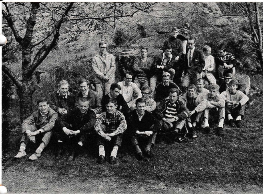
Början till en VM-trupp. Deltagarna i Bosölägret.

Vi ankom som sagt till Montreal den 27 juni och VM-seglingarna skulle börja