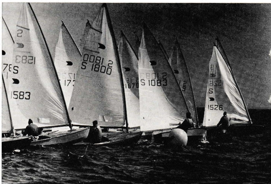
Ostkustcupen, Mönsterås. 2:a seglingens start.