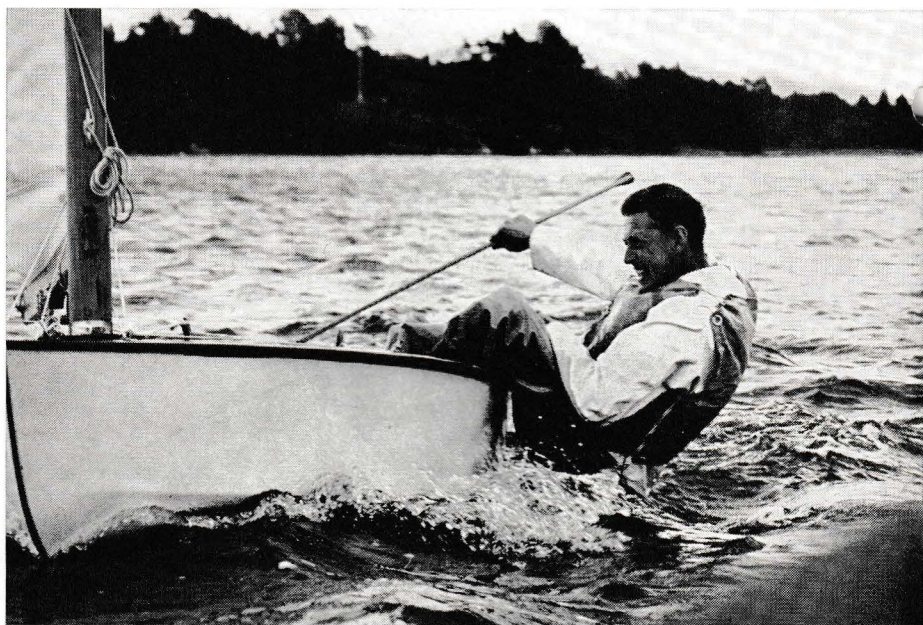
Testförare: NT-ÖD:s Hkan.