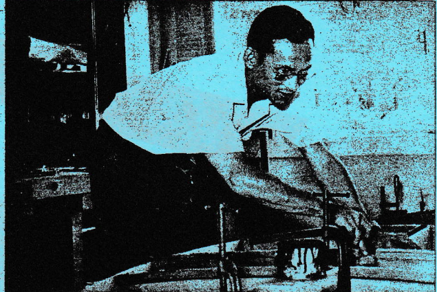
ขณะทรงงานต่อเรือใบด้วยฝีมือพระหัตถ์ของพระองค์เอง